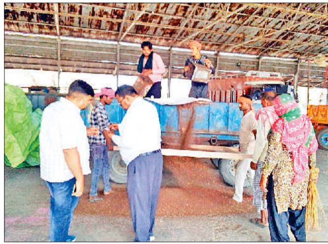
सोनीपत। फसल में नमी की मात्रा को चेक करते हुए खरीदार।

बता दें कि रबी खरीद सीजन के दौरान सरकार द्वारा गेहूं और सरसों की