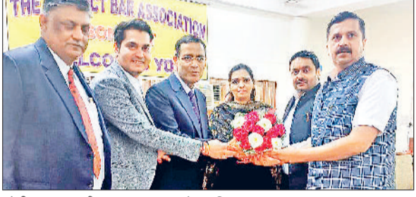
सोनीपत। न्यायाधीश का स्वागत करते हुए जिला बार प्रधान।