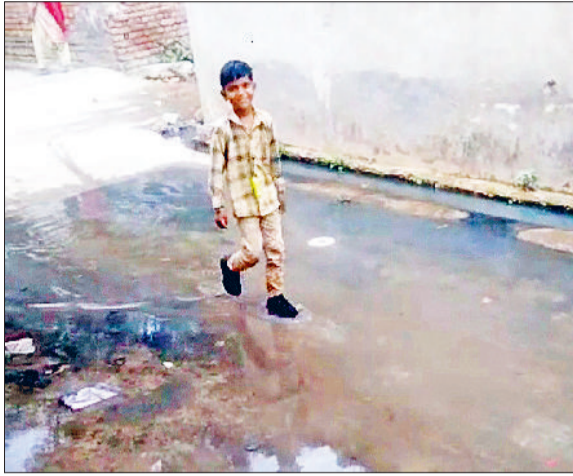
गन्नीर। गली में भरे नालियों के गंदे पानी से निकलता हुआ गली का बचा।

वार्ड 6 हरिनगर कालोनी की श्रीकृष्ण प्रणामी मंदिर वाली गली में दूषित पानी निकासी के लिए नगरपालिका द्वारा दबावाए जा रहे पाइप स्थानीय लोगों के लिए परेशानी का कारण बन गए हैं। लोगों का कहना है कि दूषित पानी की निकासी के लिए उनकी गली में दबावाए गए पाइपों की लेवलिंग ठीक से नहीं की गई है। उस समय उन्होंने इस मांग को भी उठाया था लेकिन किसी अधिकारी ने कोई ध्यान नहीं दिया। जब से वे पाइप