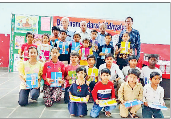
मेधावी विद्यार्थियों को सम्मानित करते हुए प्रबंध समिति के पदाधिकारी।