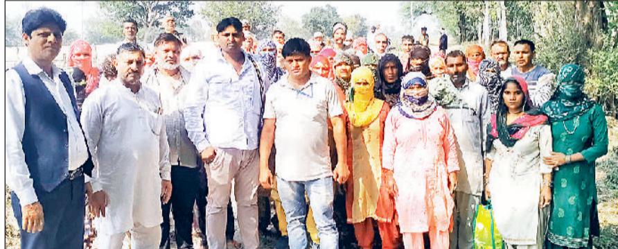
गोहाना। अपनी मांगों को पूरा करने की मांग करते हुए मनरेगा मजदूर।