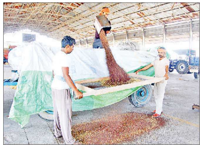
सोनीपत। सरसों को ट्राली से उतारते हुए श्रमिक।