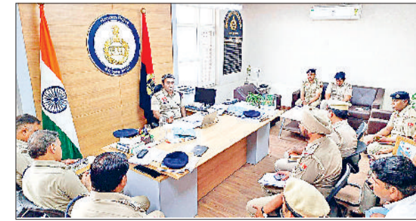
सोनीपत। बैठक के दौरान मौजूद पुलिस कर्मी।

जिले में अपराध व कानून एवं व्यवस्था बनाए रखने के लिए समीक्षा गोष्ठी का आयोजन किया गया। बैठक में पुलिस विभाग में तैनात पूर्व जेन के सभी एसीपी, ईंचार्ज अपराध शाखा, थाना प्रबंधक, व चौकी प्रभारी मौजूद रहे। विभाग के अधिकारियों की तरफ से चुनावों के मुद्देनगर रखते हुए गोष्ठी में चर्चा की गई। जिसमें जिले में घटित अपराध के आंकड़ों का विश्लेषण किया व कानून व्यवस्था को बेहतर बनाने हेतु विचार विमर्श